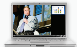
Live transmission til 2500 pc'er