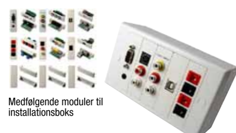
Medfølgende moduler til installationsboks

DS PRO AKTIVE HØJTTALER Suppler installationen med et par aktive højttalere og få endnu mere effekt i undervisningen. • Kan både væg- og loftmonteres • 2x30 Watt